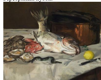
Эдуард Мане. Натюрморт с рыбой.