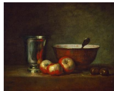
Жан-Батист Симеон Шарден. Серебряный кубок.